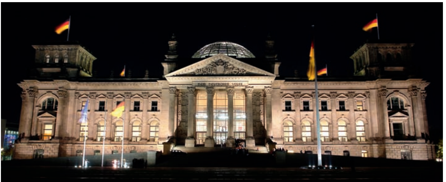
Vom Wahlsieg der FDP erhofft sich die Börse neuen Rückenwind und eine Fortsetzung der Aufwärtstendenz deutscher Aktien.

----- KOLUMNE / G20-Treffen & Wahl gut verdaut --- OPPENHEIM NEWS / Neu: Freetrade-Aktion bei der ING DiBa bis Ende März 2010 -----